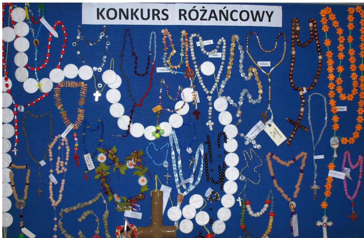
KONKURS RÓŻAŃCOWY 2017